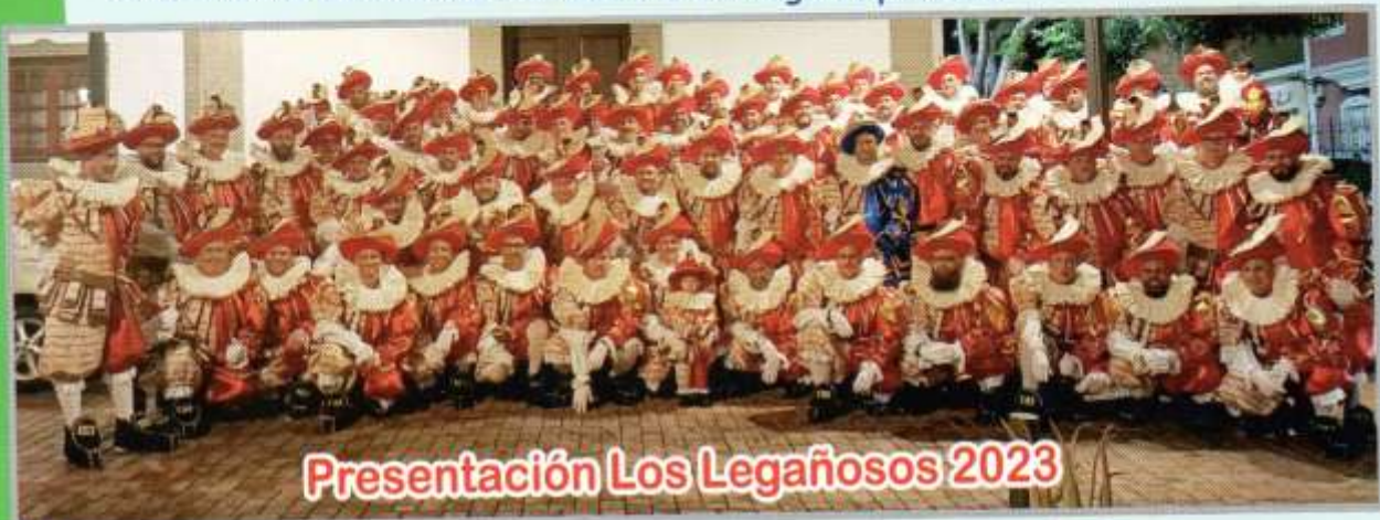
Presentación Los Legañosos 2023

En el acto de apertura y cierre del Concurso+deliberación del Jurado, actuación de colectivos invitado a la entrega de premios