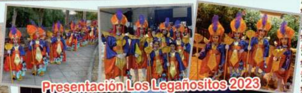
Presentación Los Legañositos 2023